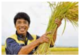
大潟村のお米の生産者さん