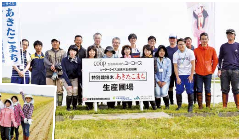
秋田県大潟村の田植え体験