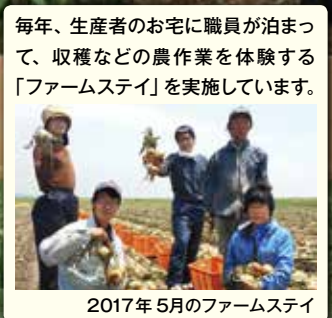
毎年、生産者のお宅に職員が泊まって、収穫などの農作業を体験する「ファームステイ」を実施しています。2017年5月のファームステイ

よりおいしく、安心できる産直をめざして。おうちCO-OPは生産者と産地を応援する組合員、そして職員、みんなの思いがひとつになった農作物を「まるごと産直」として扱い、お届けしています。