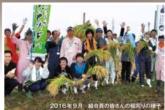
2016年9月 組合員の皆さんの稲刈りの様子

その地域で一般的に行われている栽培方法に比べて、化学合成農薬と化学肥料の使用を半分以上に減らして栽培したお米です。